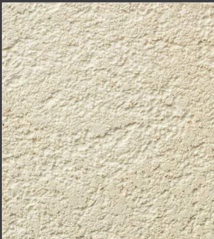
NZY-HN (粗砂) 20