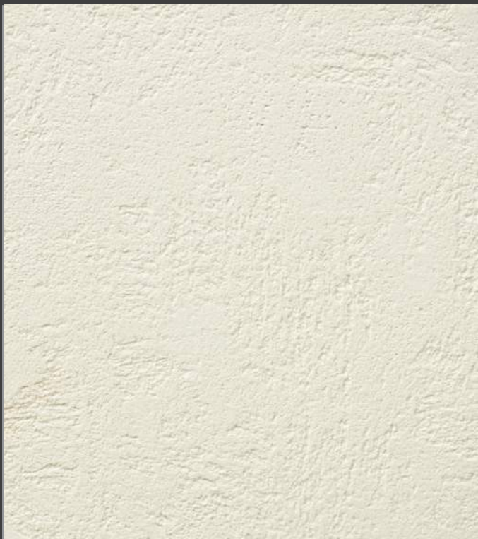
NZY-HN (细砂) 19